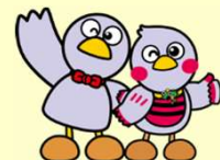
埼玉県のマスコット 「コバトン」「さいたまっちゃん」

※ 交付決定後に就業規則を改正し、上記の取組(就業規則の改正)を実施する場合は対象となります。